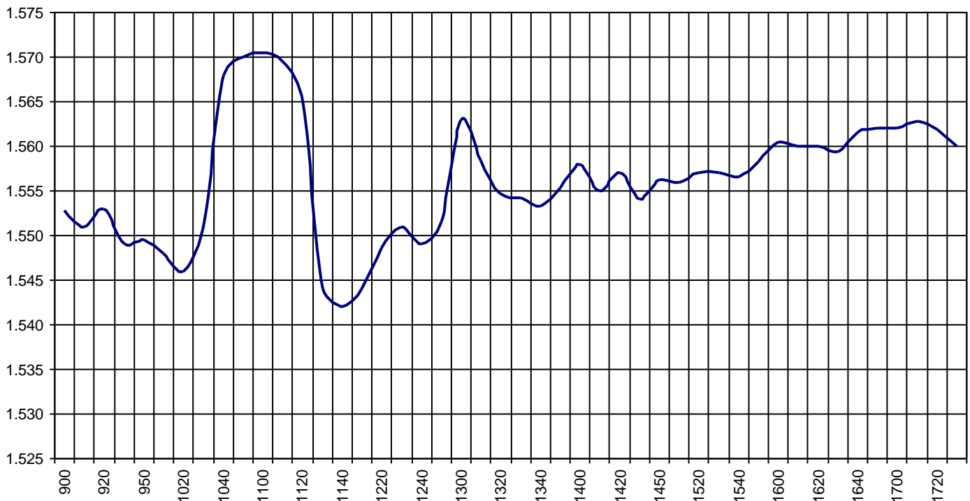
Valor medio del índice IBEX MAB® 15 cada 10' (Index Average every 10')