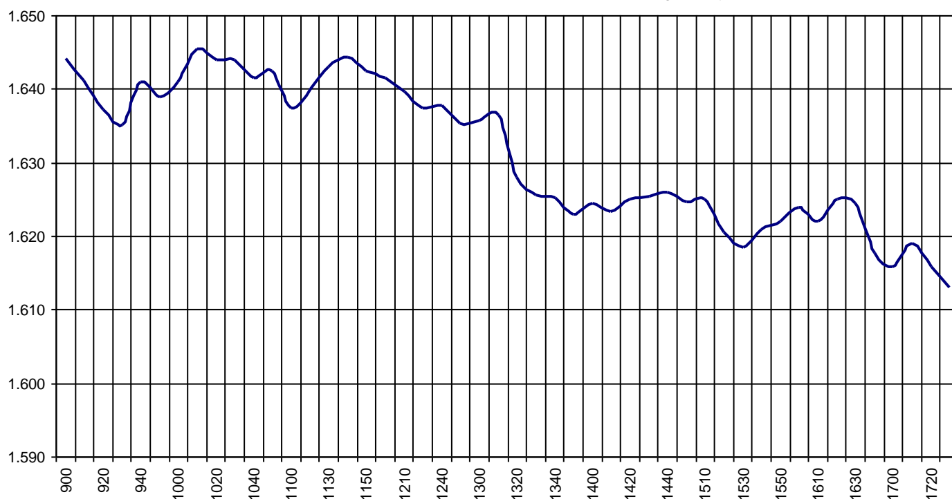
Valor medio del índice IBEX MAB® 15 cada 10' (Index Average every 10')