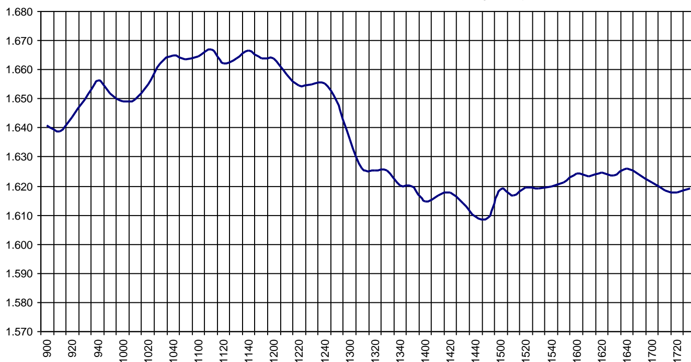
Valor medio del índice IBEX MAB® 15 cada 10' (Index Average every 10')