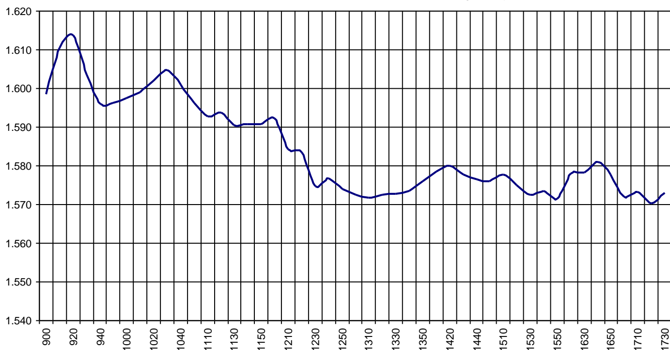
Valor medio del índice IBEX MAB® 15 cada 10' (Index Average every 10')