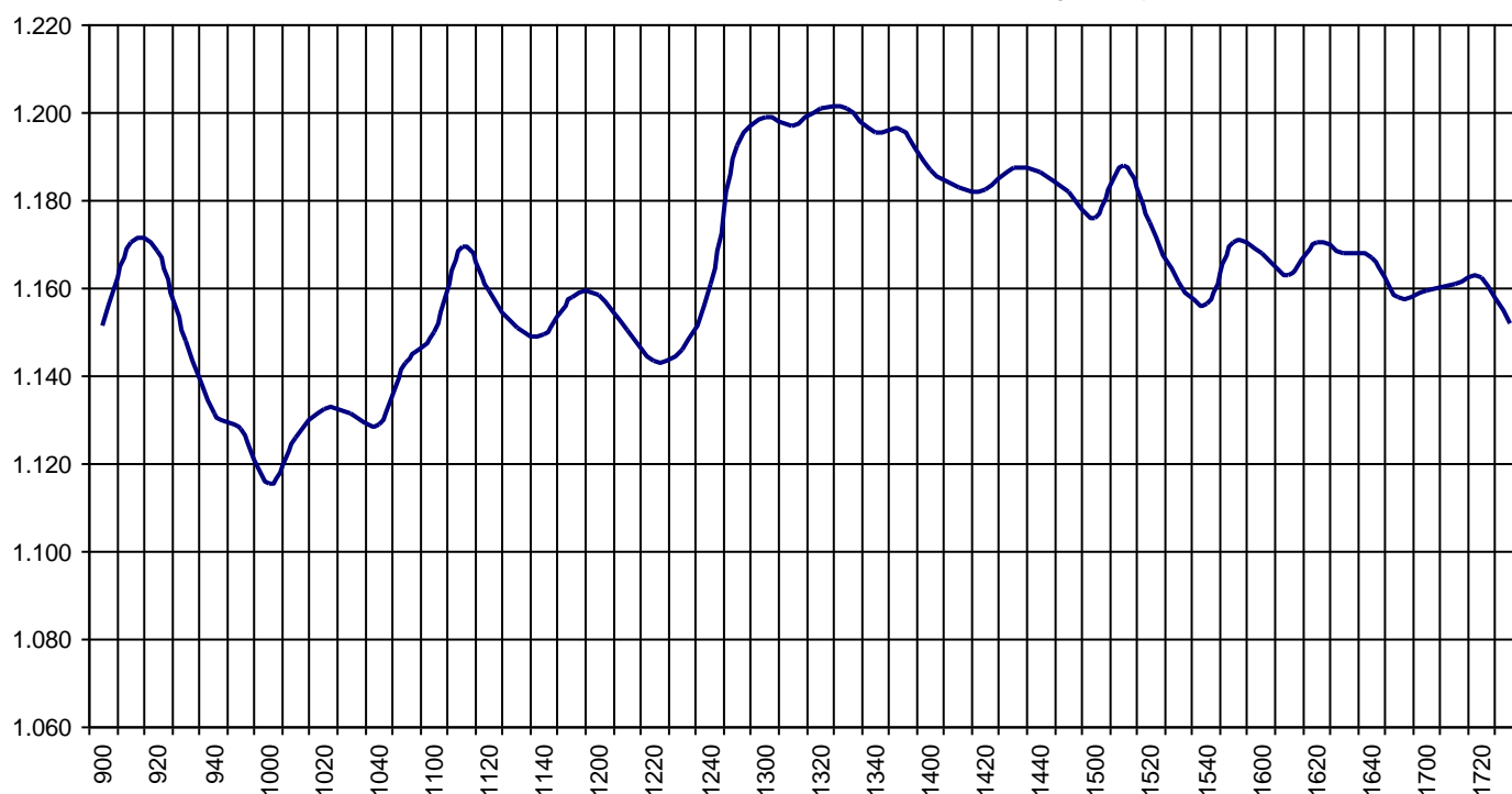
Valor medio del índice IBEX MAB® 15 cada 10' (Index Average every 10')