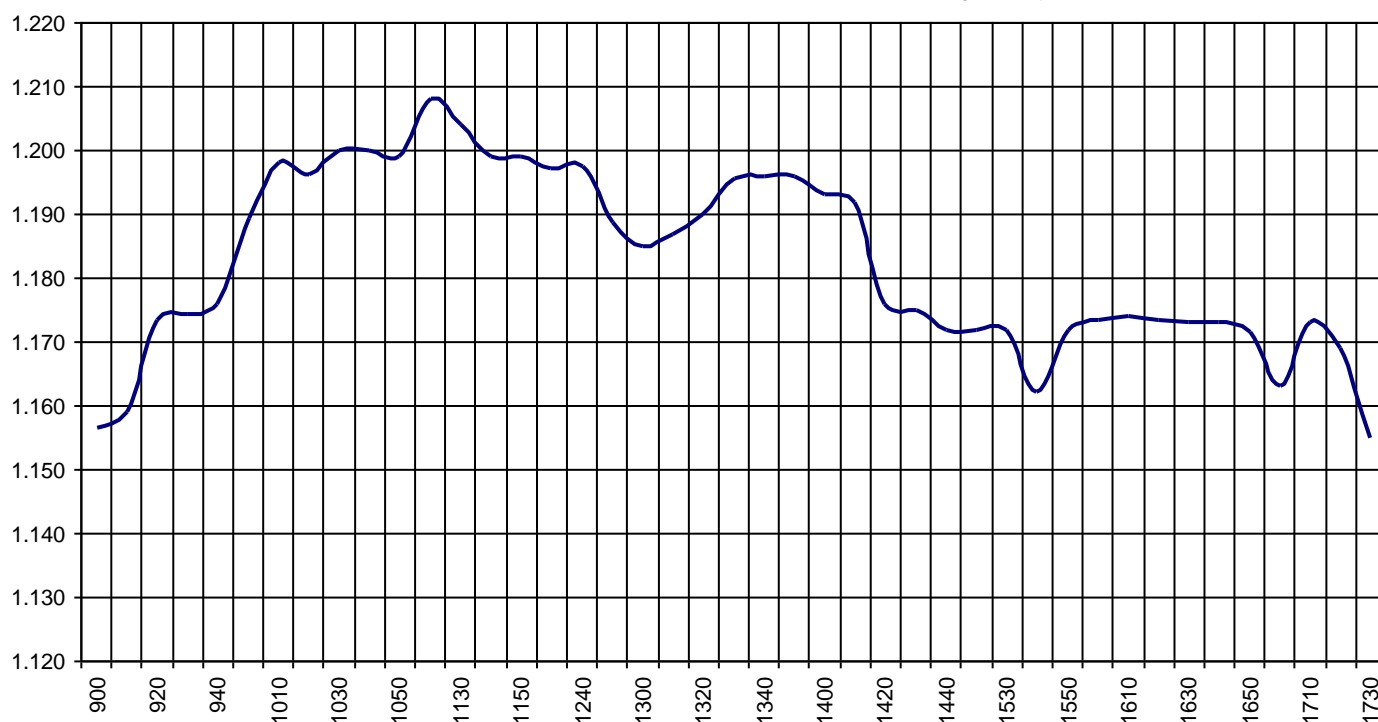
Valor medio del índice IBEX MAB® 15 cada 10' (Index Average every 10')