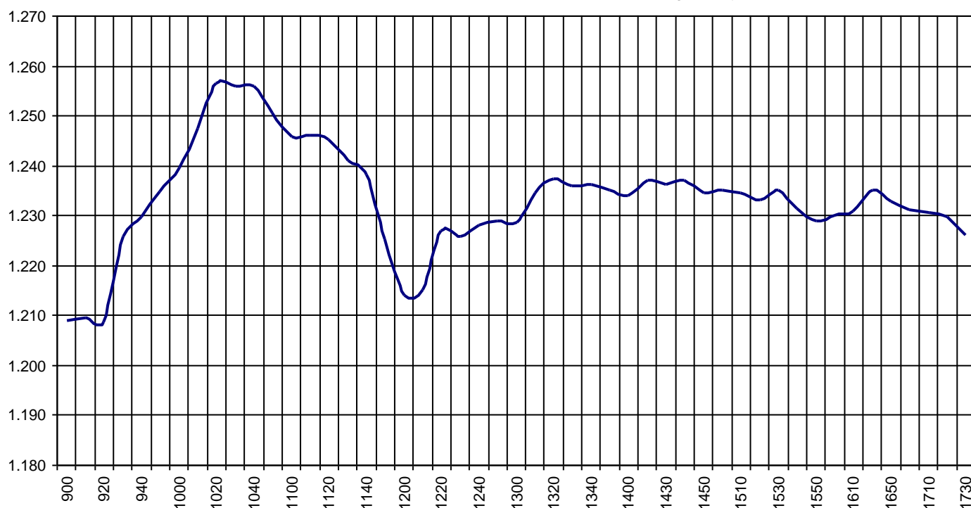
Valor medio del índice IBEX MAB® 15 cada 10' (Index Average every 10')