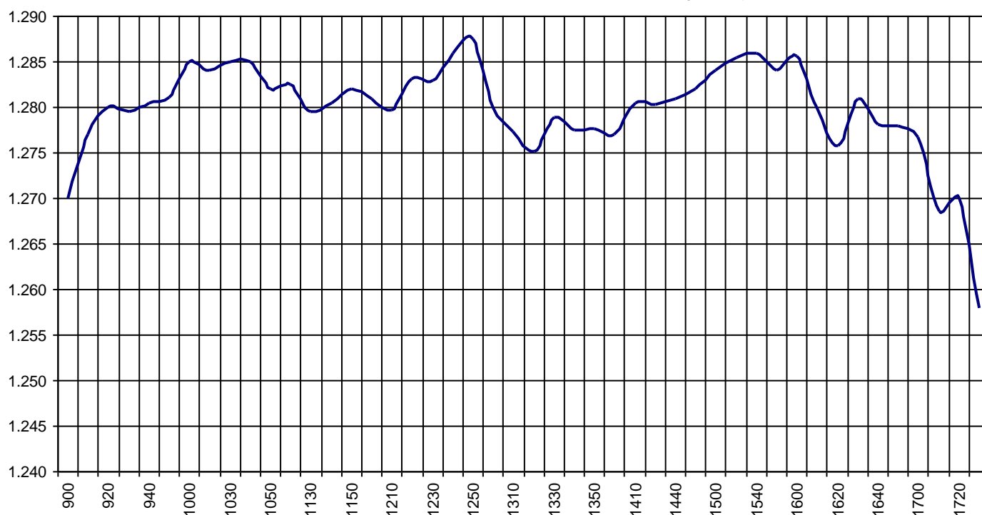
Valor medio del índice IBEX MAB® 15 cada 10' (Index Average every 10')