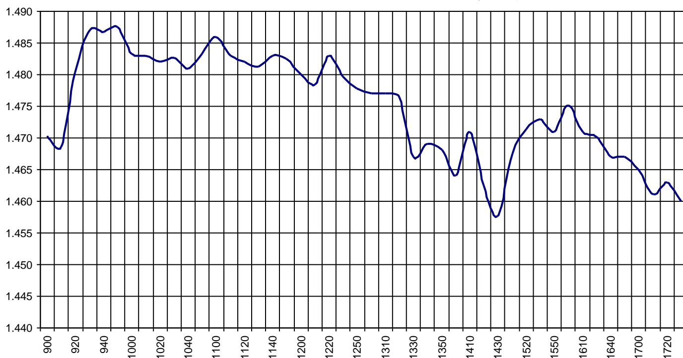
Valor medio del índice IBEX MAB® 15 cada 10' (Index Average every 10')