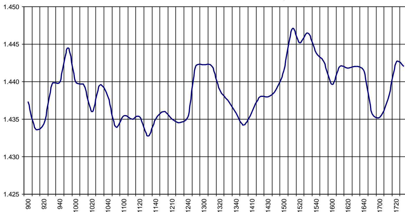
Valor medio del índice IBEX MAB® 15 cada 10' (Index Average every 10')