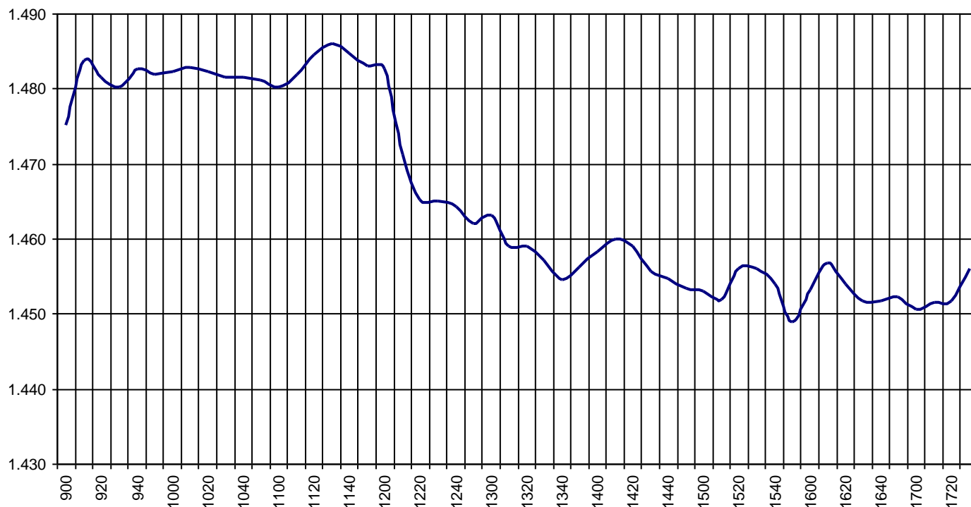
Valor medio del índice IBEX MAB® 15 cada 10' (Index Average every 10')