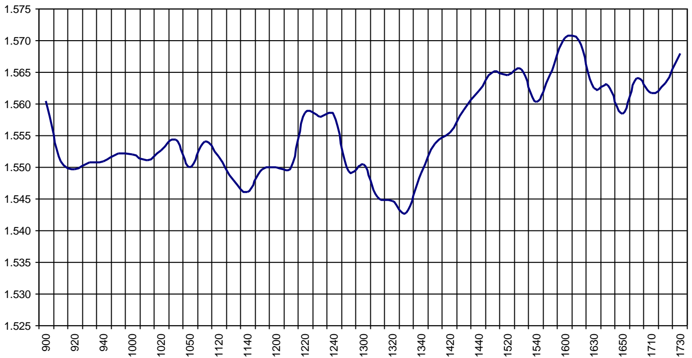
Valor medio del índice IBEX MAB® 15 cada 10' (Index Average every 10')