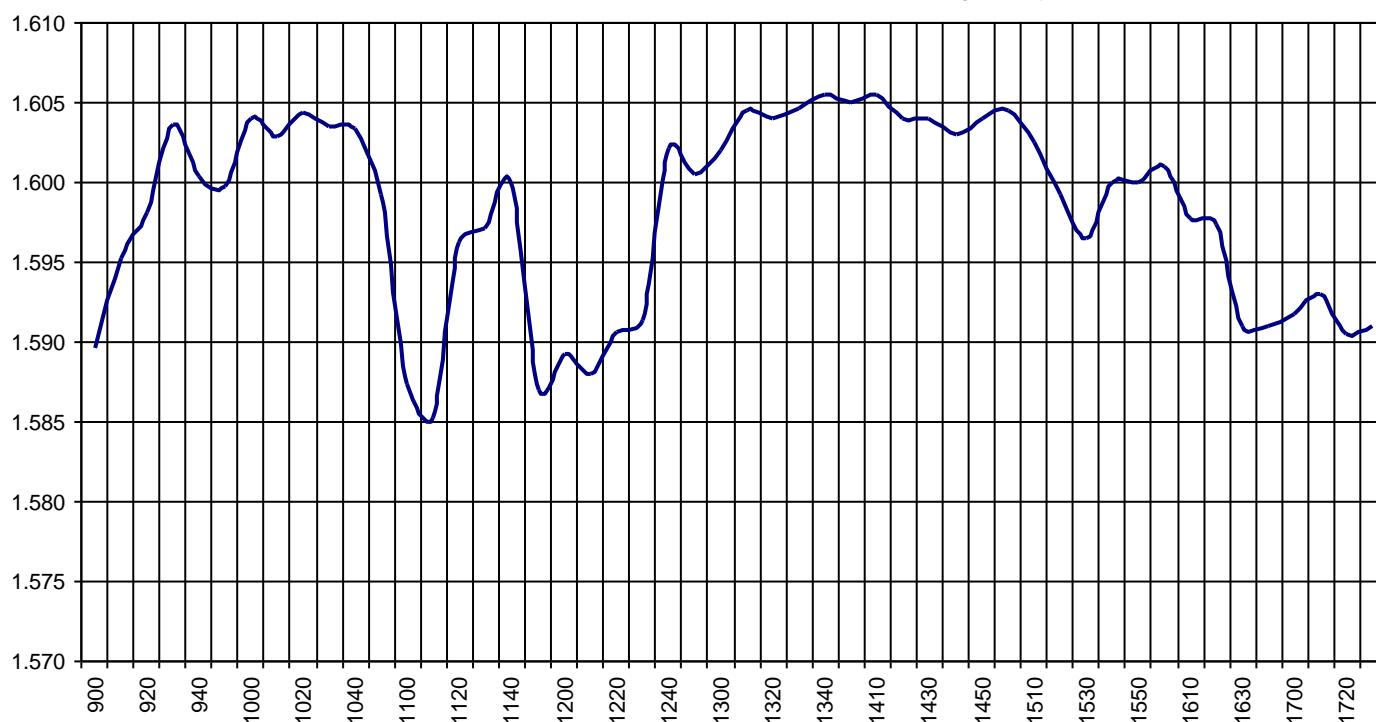
Valor medio del índice IBEX MAB® 15 cada 10' (Index Average every 10')