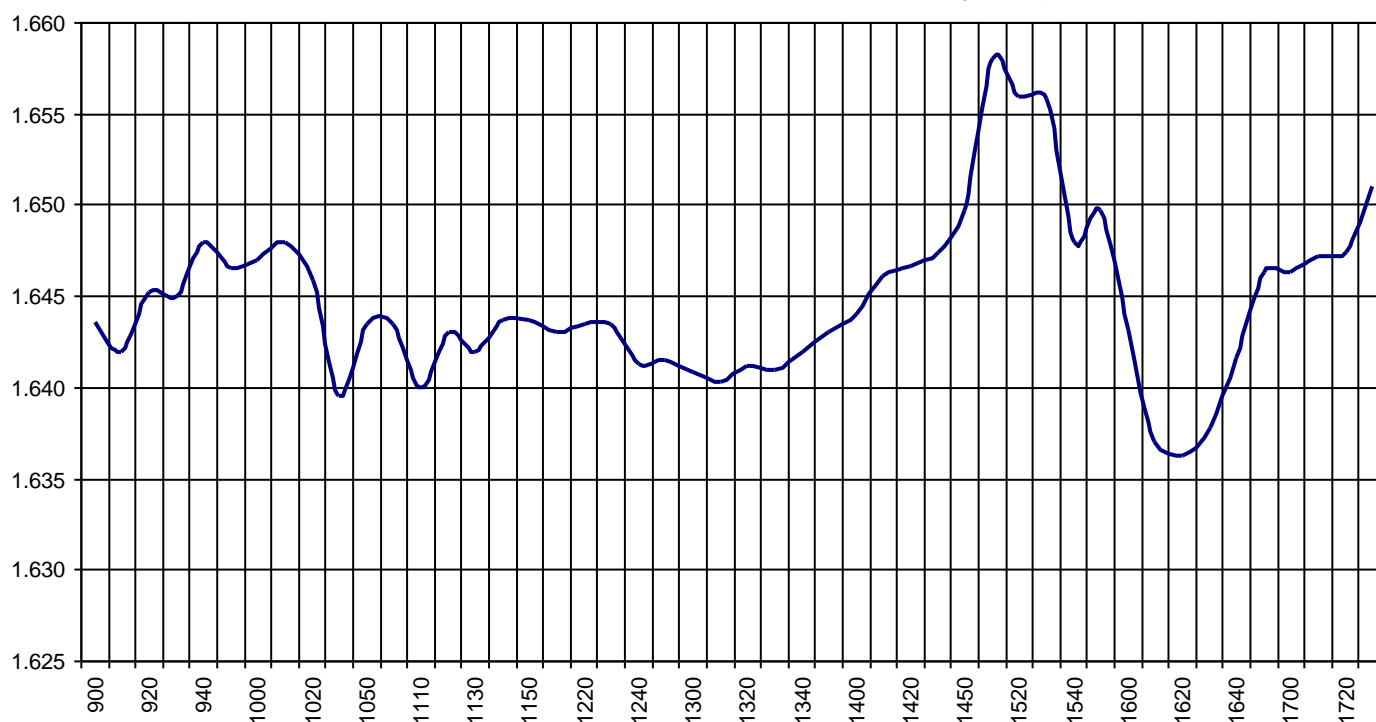
Valor medio del índice IBEX MAB® 15 cada 10' (Index Average every 10')