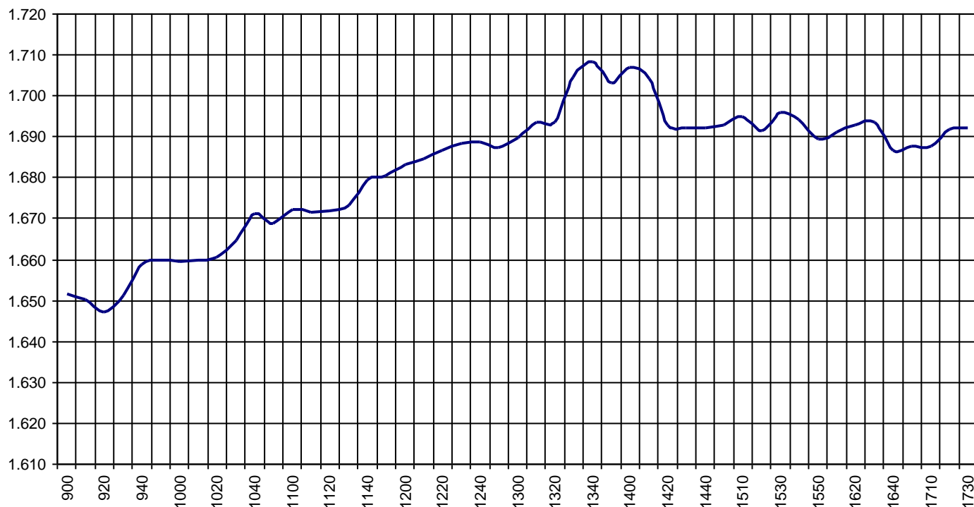
Valor medio del índice IBEX MAB® 15 cada 10' (Index Average every 10')