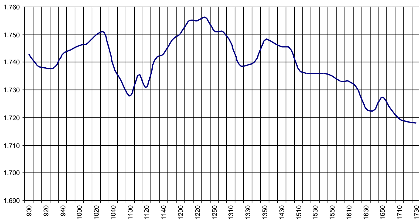
Valor medio del índice IBEX MAB® 15 cada 10' (Index Average every 10')