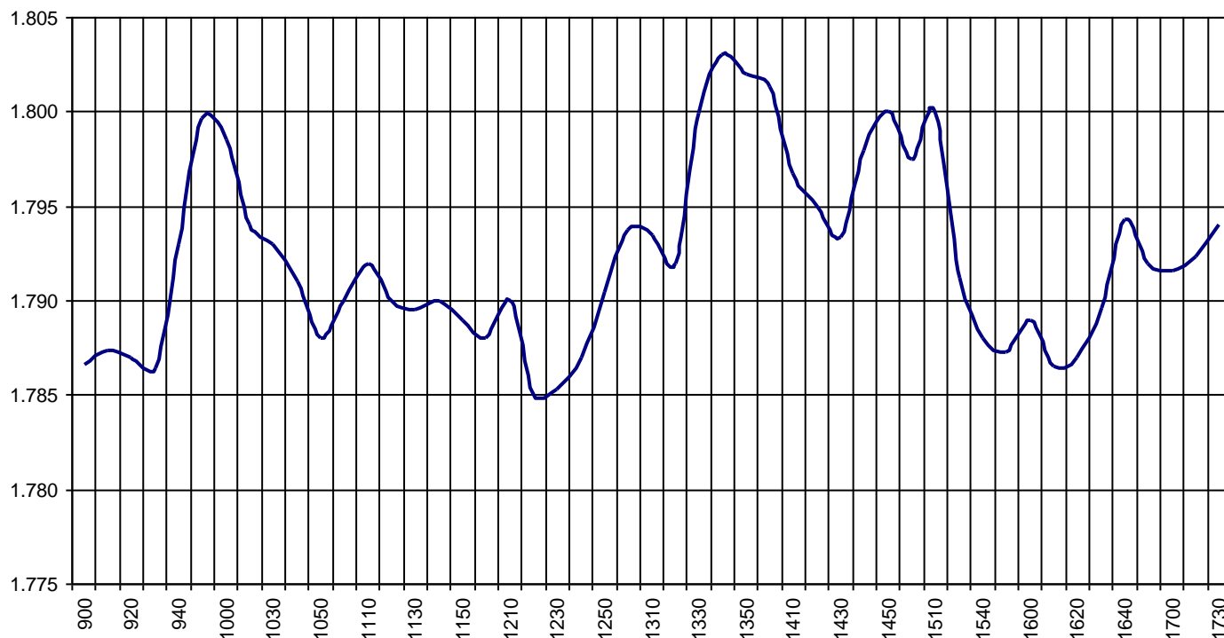
Valor medio del índice IBEX MAB® 15 cada 10' (Index Average every 10')