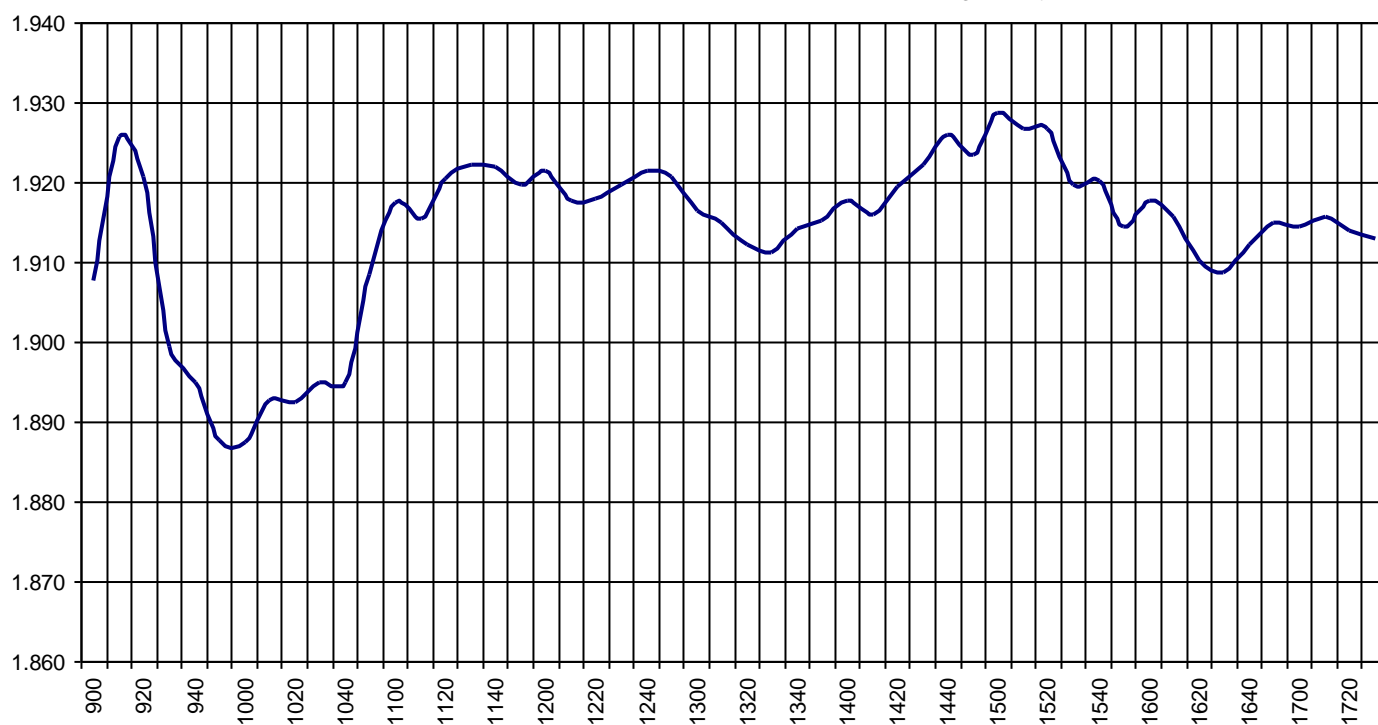
Valor medio del índice IBEX MAB® 15 cada 10' (Index Average every 10')