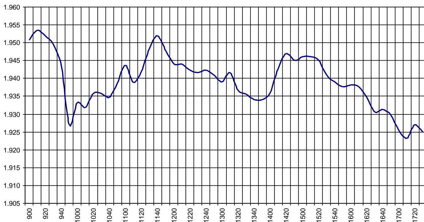
Valor medio del índice IBEX MAB® 15 cada 10' (Index Average every 10')