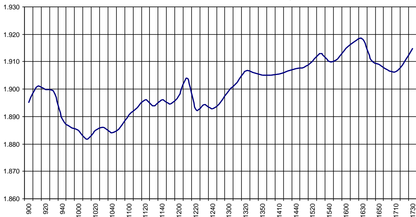
Valor medio del índice IBEX MAB® 15 cada 10' (Index Average every 10')