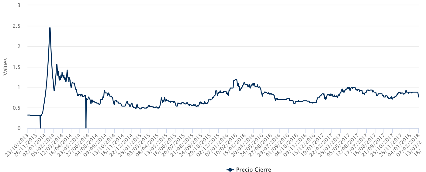
Evolución de cotización