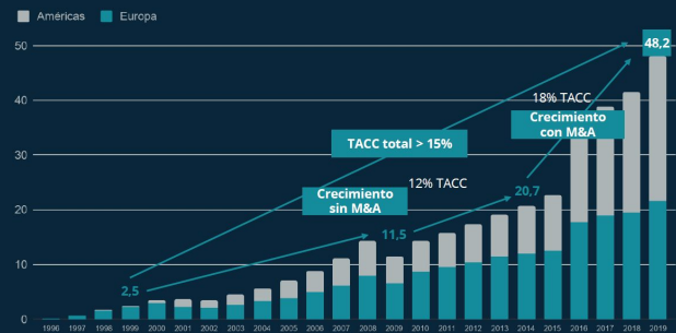
EVOLUCIÓN DE INGRESOS Millones de euros