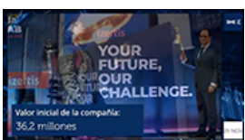
Video Toque de Campana de Izertis